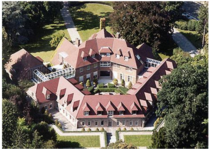
Sede internazionale: Tervuren – Bruxelles, Belgio

Alta qualità, estetica, versatilità, durabilità, resistenza, ecosostenibilità, facilità di installazione, elevate prestazioni: Creaton Italia significa tutto questo. Etex Group da anni ha puntato all'innovazione e allo sviluppo di nuovi materiali per l'edilizia per incontrare le nuove esigenze emerse in tema di estetica, prestazioni ed ecosostenibilità , come testimoniano le dichiarazioni ambientali di prodotto (EPD) che "accompagnano" gran parte dei suoi materiali.