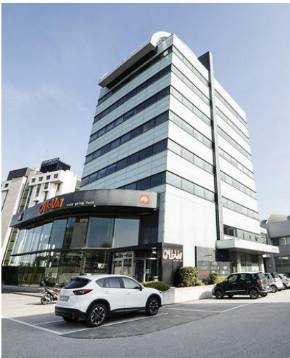
Sede italiana: BICENTER - Padova

Creaton Italia è un'azienda commerciale parte di Etex Group , multinazionale nel settore rivestimenti in fibrocemento ecologico per facciate ventilate . Nata come filiale italiana del grande gruppo internazionale nel 2014, l'azienda ha sede a Padova e nella sua offerta può contare su una vasta gamma di materiali realizzati da stabilimenti in Belgio e Germania con oltre 100 anni di produzione alle spalle.